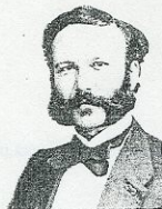
PRIX HENRY DUNANT

Académie de droit international humanitaire et de droits humains à Genève Geneva academy of international humanitarian law and human rights